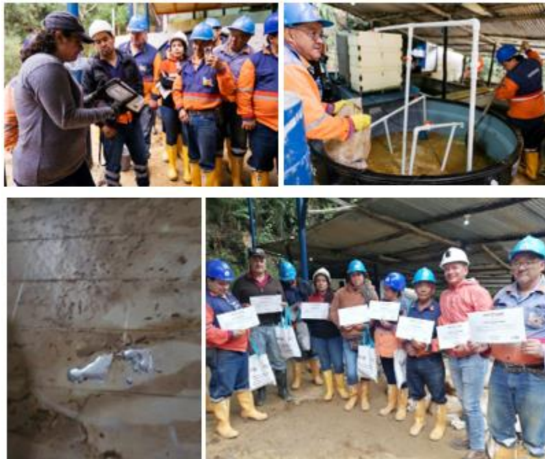
Figura 2. Montaje y entrenamiento en tecnología de placas de cobre en California, Santander