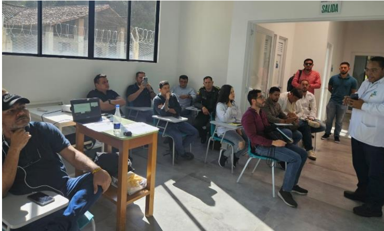
Figura 4. Entrenamiento en la CDMB