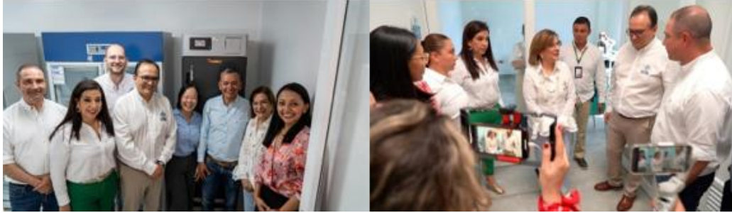
Figura 3. Lanzamiento de la unidad de almacenamiento temporal de mercurio